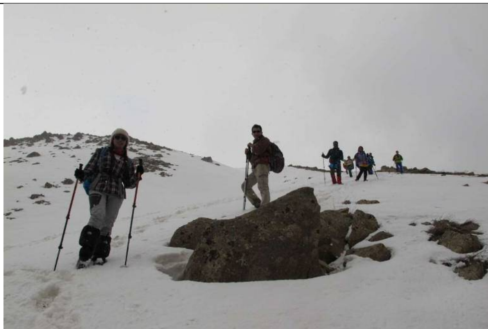
در مسیر برگشت