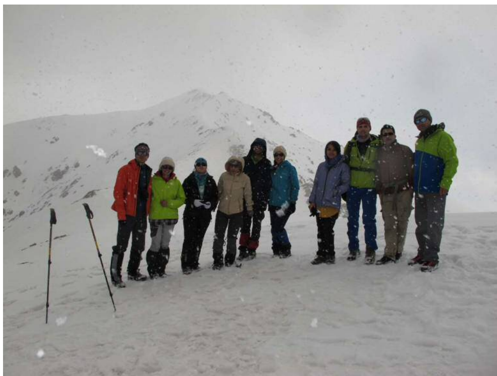
آخرین نقطه پیمایش شده (قله در انتها دیده میشود)