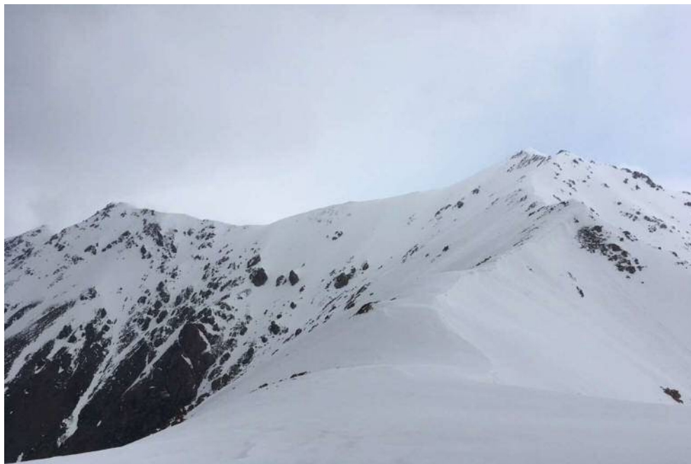
قله فیل زمین و خط الاراس غربی