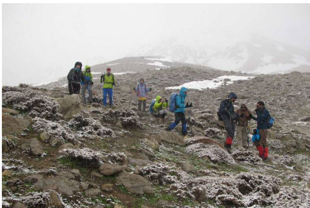
و فرود در هوای برفی اردیبهشت